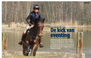
De kick van eventing